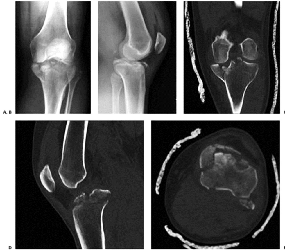
Figure 61-3 Varus hyperextension tibial plateau fracture. A: AP view showing varus alignment and fracture of the medial tibial plateau. B: Lateral view showing compression failure of the anterior cortex and tension failure of the posterior cortex with loss of or reversal of posterior tibial slope. Coronal (C), sagittal (D), and axial (E) CT scans showing the fracture pattern in greater detail.